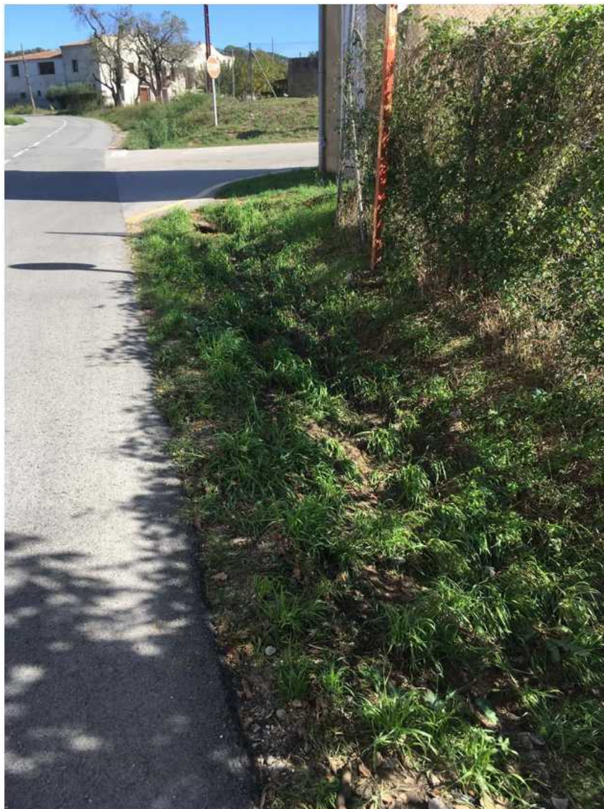
Imatges de l'estat actual de la vorera.