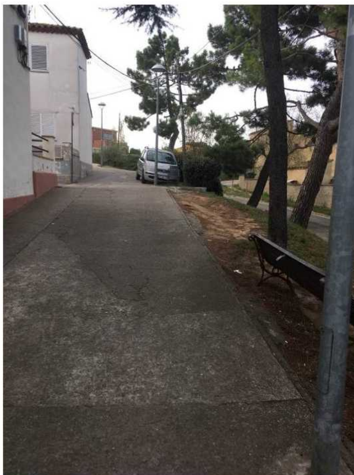
Imatges de l'estat actual del paviment de formigó de la vorera

A l'espai públic entre aquestes cases i el carrer Llagostera, a dalt al marge esquerra des de la Rambla Onze de Setembre, hi ha un paviment de formigó que es troba en molt mal estat i amb moltes irregularitats.